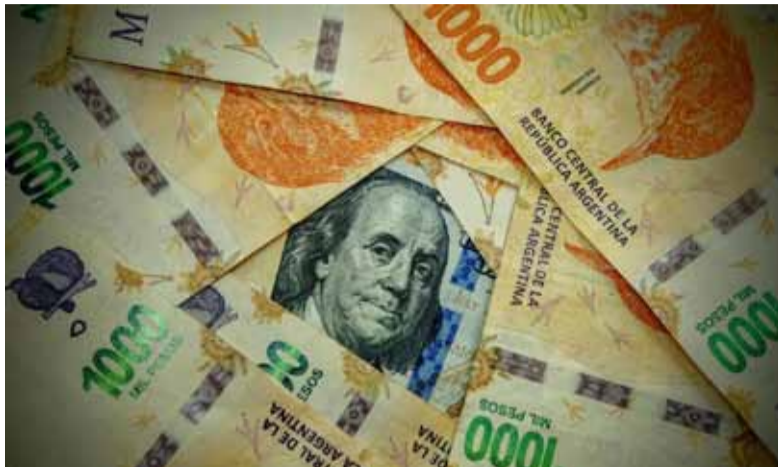
El peso. Sorprende con su fortalecimiento frente a divisas

En tanto, el rubro energético sería el sector que, con proyec-