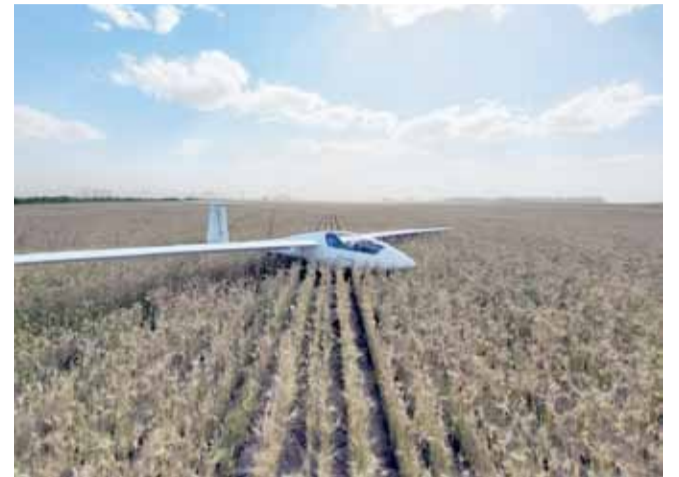
Una imagen que refleja lo difícil que resultó la jornada del lunes, cuando las condiciones climáticas no fueron del todo favorables.

Tras un domingo sin actividad debido a la lluvia, el lunes parecía darle el visto bueno a un comienzo de semana positivo al Campeonato Nacional que está disputándose en Bolívar. En horas del mediodía, de manera ágil, los planeadores fueron remolcados con el fin de disputar la cuarta prueba puntuable, pero las condiciones climáticas posteriores hicieron que muchos de ellos no pudieran completar el recorrido establecido. Algunos de los participantes decidieron regresar al aeródromo al no poder encontrar las condiciones necesarias para continuar en carrera, y otros quedaron en campos de la zona. Por lo tanto fue ardua la tarea de los equipos de asistencia en tierra y de la organización, ocupada de brindar apoyo de distintas maneras, por ejemplo aportando contactos de productores agropecuarios para que abran sus tranqueras y permitan el acceso a sus campos para retirar los planeadores, o bien preocupándose para que, al final de esta octava jornada del campeonato, todos los equipos finalizaran el día en las instalaciones del Club de Planeadores.