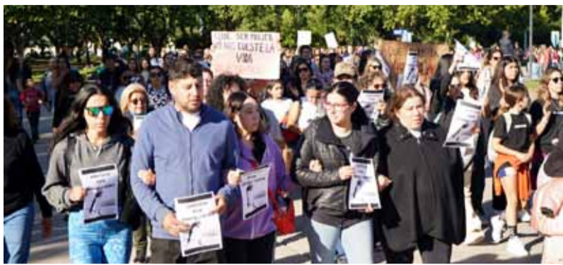
Marcha. Se realizó este martes en Necochea

Una mujer fue golpeada por su pareja hasta causar la muerte. Debido al hecho, se dieron a conocer imágenes de las cámaras de seguridad privadas de Necochea. La autopsia determinó que la joven tenía golpes previos a la caída al río, donde los investigadores la encontraron muerta.