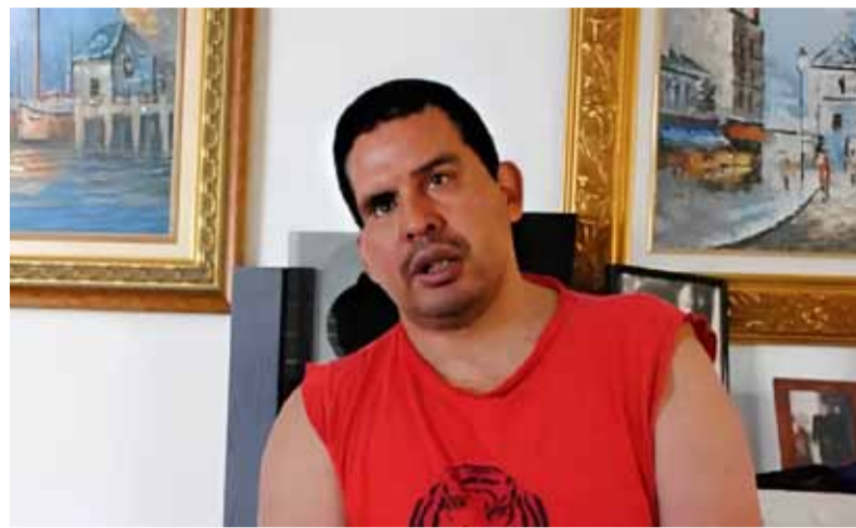
Misteriosa muerte. Desata reclamos de justicia y esclarecimiento

tomaba alcohol, pero no había nadie más que ellos dos en el lugar", consideró y agregó: "Es imposible que mi hermano la haya empujado a ella porque no tiene estabilidad para quedarse parado".