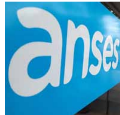
Logro. De ANSES marca un hito en el orden fiscal nacional

Por el contrario, mencionaron que se tomaron las siguientes medidas: se suspendieron las transferencias a las cajas previsionales provinciales que no fueron transferidas a la Nación; se vetó la ley de movilidad jubilatoria que proponía mejoras en los haberes de los jub-