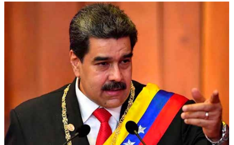
Conflicto en Caracas. Nicolás Maduro

“La impunidad no solo perpetua el sufrimiento de las víctimas, sino que también erosiona los fundamentos del orden jurídico internacional”, concluyó.