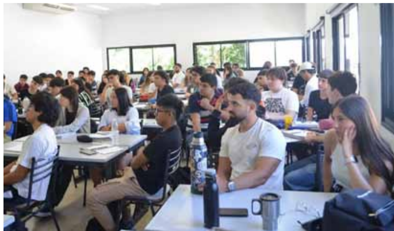
Desde enero. Universidades y hospitales cobrarán a extranjeros

Adorni recalcó que los aranceles que se podrán cobrar a los estudiantes extranjeros no residentes representarán "una fuente de financiamiento para las casas de estudios". "Solamente a modo de ejemplo, uno de cada tres estudiantes de medicina es extranjero", explicó.