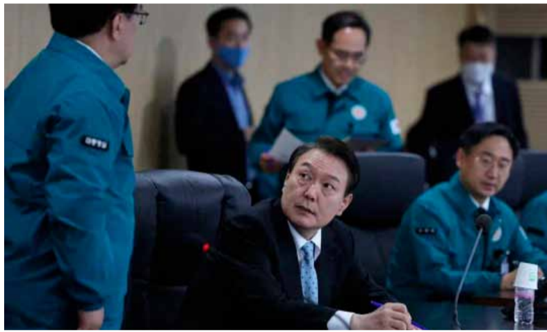
Firme postura. El presidente de Corea del Sur, Yoon Suk-yeol

Yoon Suk-yeol había declarado este martes la ley marcial de emergencia para proteger el “orden constitucional” de actividades “antiestatales”, de las que el mandatario acusa al principal bloque de la oposición, el Partido Democrático (PD), al que tildó de “fuerzas pronorcoreanas” en