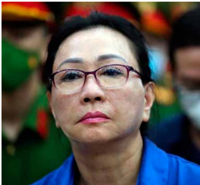
A muerte. Justicia vietnamita aplica pena máxima en caso de fraude

teció a más de 42.000 víctimas de la estafa, depositarios y tenedores de activos del Banco Comercial de Saigon (SCB) en su mayoría, que no logran ni cobrar los intereses ni recuperar el dinero depositado.