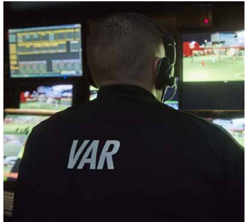
VAR protagonista. En histórica final del ascenso argentino

San Martín de San Juan y Gimnasia de Mendoza se enfrentarán el próximo domingo en el duelo que definirá el segundo ascenso a la Primera División del fútbol argentino y el partido contará con la implementación del VAR, una medida excepcional para la categoría.