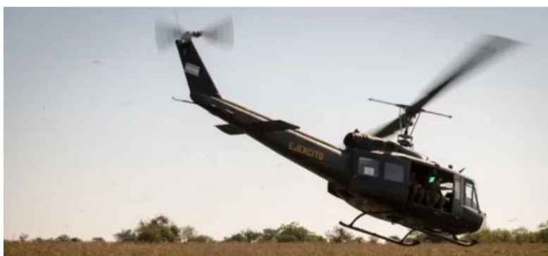
Rescate. En Mendoza tras caída de helicóptero militar

El helicóptero pertenece a la Sección de Aviación de Ejército