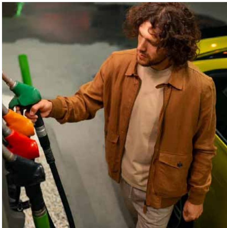
Autodespacho. Será realidad en las estaciones argentinas

El ministro de Desregulación y Transformación del Estado de la Nación Argentina, Federico Sturzenegger, dijo hoy que el Gobierno publicará una nueva normativa para permitir el autodespacho de combustible en estaciones de servicio.