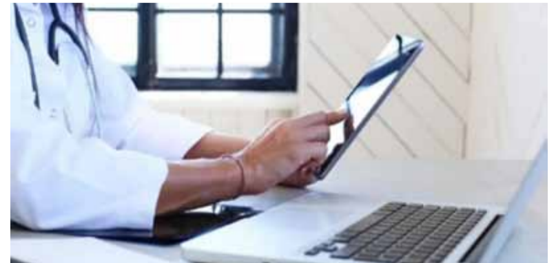
Digitalización. Avanza con recetas electrónicas obligatorias

A partir del 1° de enero de 2025, miles de profesionales médicos se verán obligados a despedirse del clásico recetario de papel y deberán pasar de manera obligatoria a la receta médica electrónica. No obstante, los cambios no se implementarán de forma homogénea, ya que no todas las jurisdicciones adoptaron dicha medida.