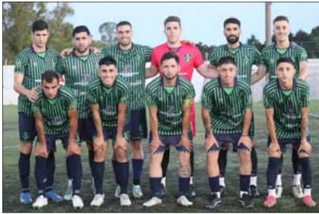
Embajadores pasó a tercera ronda, donde enfrentará a Racing.