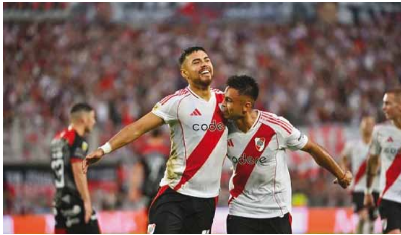
River. Enfrenta a San Lorenzo con objetivo claro en Libertadores