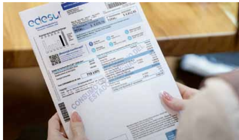
La quita de subsidios. Se aplaza para aliviar impacto social

Para tomar la decisión, la Secretaría realizó evaluaciones “en cuanto a la respuesta de los usuarios a la reestructuración progresiva del régimen de sub-