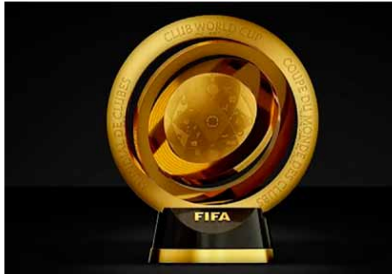
Expectativa. Por sorteos de Mundial de Clubes con equipos argentinos

Bombo 1: Manchester City (Inglaterra), Real Madrid (España), Bayern Múnich (Alemania), PSG (Francia), Flamengo (Brasil), Palmeiras (Brasil), River Plate (Argentina) y Fluminense