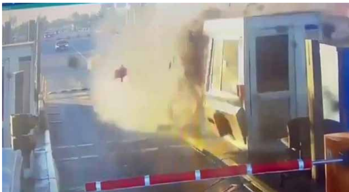
Tragedia. En autopista deja saldo de una víctima mortal

Un hombre falleció en un choque fatal en la autopista Panamericana luego de incrustarse en la cabina de peaje. El siniestro tuvo lugar alrededor de las 7 en el peaje ubicado en el ramal Campana, altura Pacheco, en el kilómetro 33,7. Por el accidente hay