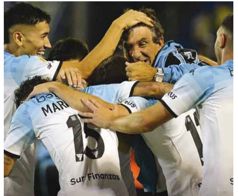
Avellaneda. Se prepara para duelo clave de Racing contra Estudiantes