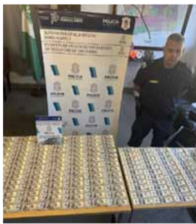
Justicia avanza contra banda responsable de torturas y robo

Personal del servicio externo de las comisarías del Municipio